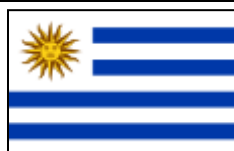
Uruguay - Uruguay