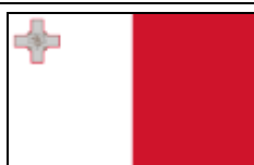
Malte - Malta