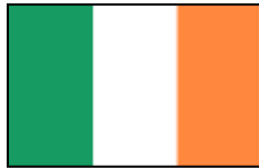
Irlande Republik Irland