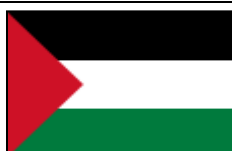
Palestine - Palästina