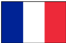
France - Frankreich