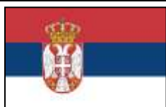
Serbie - Serbien