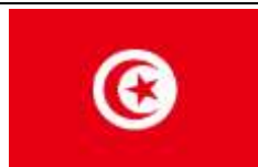
Tunisie - Tunesien