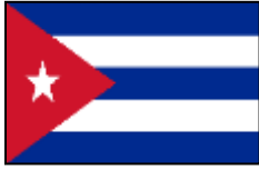
Cuba - Kuba