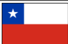
Chili - Chile