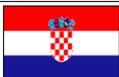
Croatie - Kroatien

Direktion: Salón contiguo a la Iglesia de Santa Rosa Santo Domingo, Heredia - Costa Rica