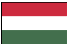
Hongrie - Ungarn