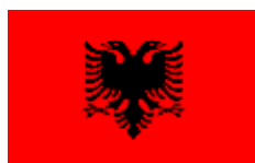
Albanie - Albanien