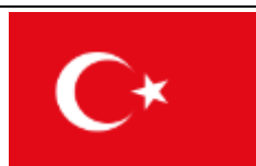
Turquie - Türkei

Sekretär: Walid Touzri Imm Molka Bureau B2 Les jardin du Lac Lac 2 1053 Tunis - Tunisie Tel: +216 (0)33650149236 contact.comtunisie@gmail.com