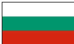
Bulgarie - Bulgarien