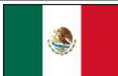
Mexique - Mexiko