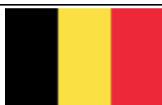
Belgique - Belgien