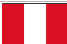
Perou - Peru