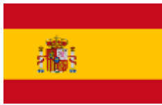
Espagne - Spanien