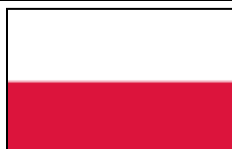
Pologne - Polen