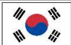
Corée du Sud Republik Korea