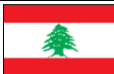
Liban - Libanon